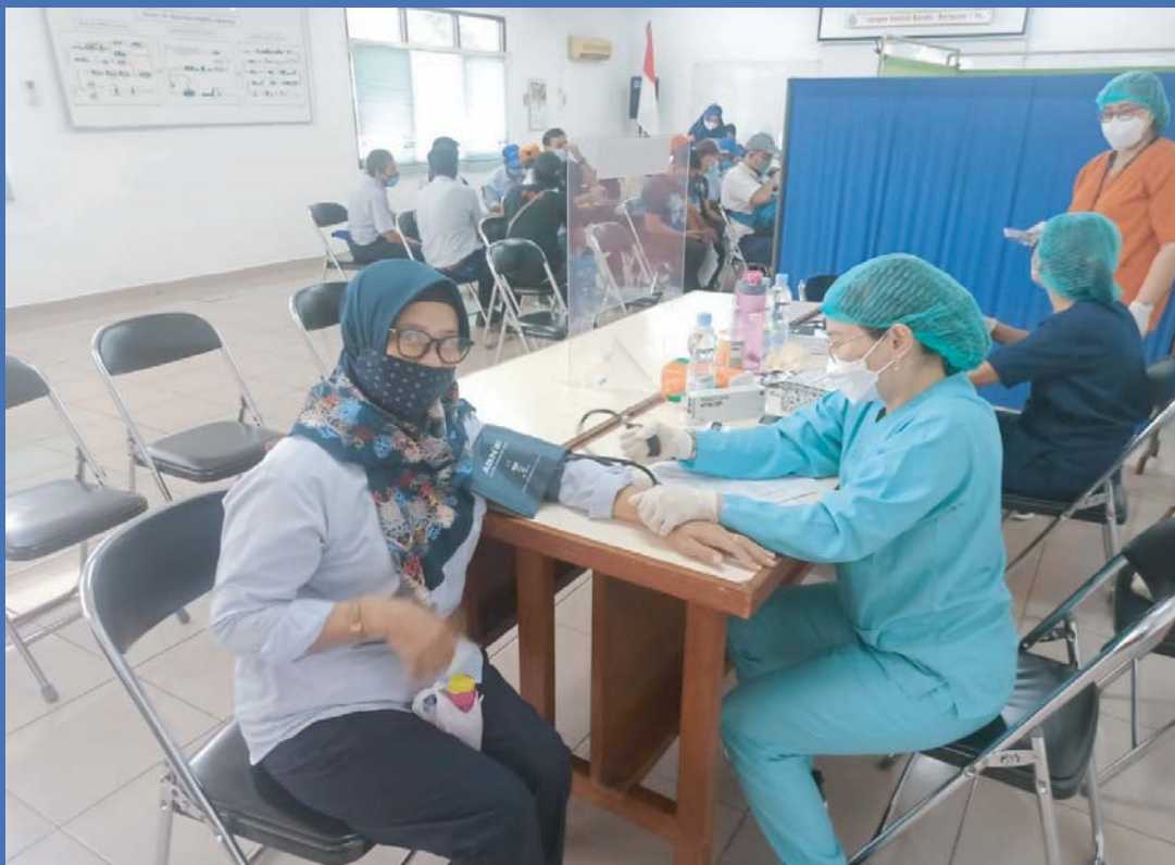
Penyelenggaraan Vaksin Covid 1, 2 dan 3 (booster) oleh PT Century Textile Industry Tbk Organizing administration of 1st, 2nd and 3rd (booster) of Covid Vaccine by PT Century Textile Industry Tbk