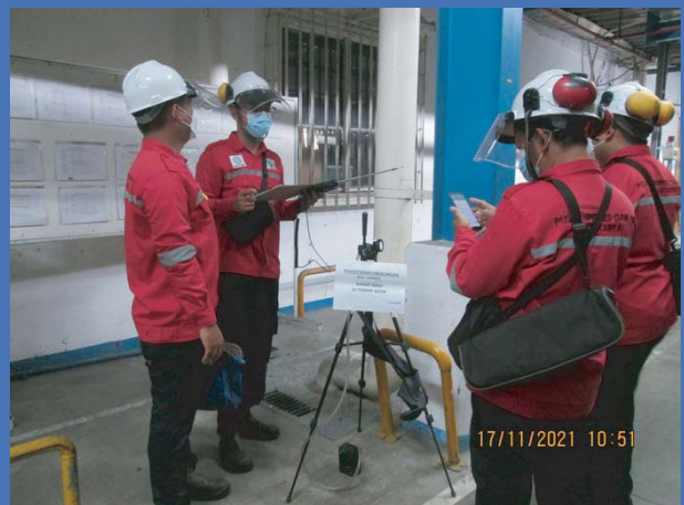
Pemeriksaan kadar emisi, debu, kebauan dan kebisingan Inspection of emission, dust, odor and noise levels